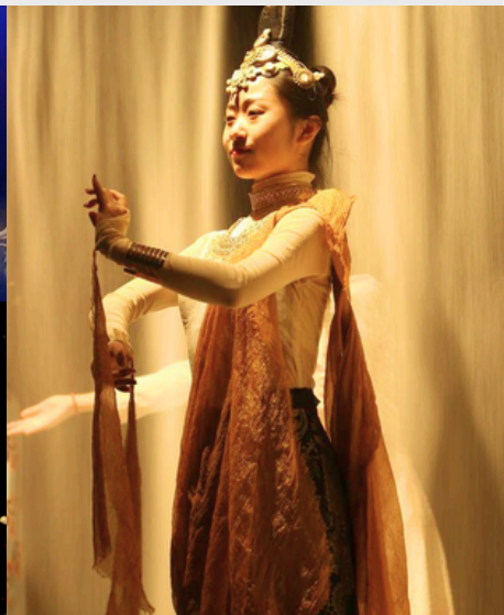
一眼千年, 在敦煌遇見《又見敦煌》