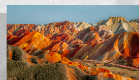
張掖七彩丹霞地質公園